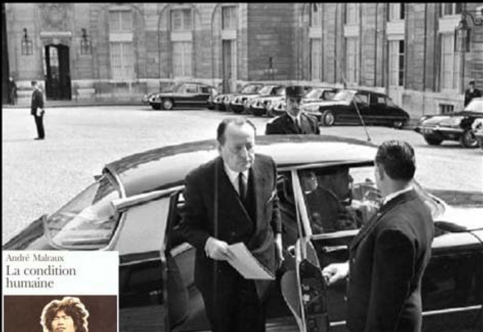
André Malraux La condition humaine